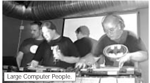
Large Computer People.

Musiikista päästiin nauttimaan 45:n yläkertaan. Nokkelalla Large Computer People -nimellä varustettu DJ-ryhmä soitteli biisejä ennen ja jälkeen AD:n esiintymisen. LCP:n musiikki sai olon tuntumaan kotoisalta. Tässäpä viimein baaritapahtuma, jossa allekirjoittanutkin kunnolla viihtyi. Mistähän näitä saisi lisää? Juuri tähän sitä kaivattiin, ja hienoa, että ihmisiä oli löytänyt paikalle paljon.