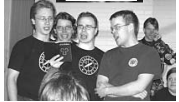
Osaavat tollilaisetkin laulaa teekkarilauluja!

maa ja M/S Meloodiaa kohti. Reipas kolmetuntinen Suomenlahdella kului rattoisasti Saku Tumea maistellen. Tallinnan satamassa joku kiireinen ehti muita odottaessa jopa tumman oluen nauttia, ennen kuin A-terminaalilta ehdimme hanhenmarssia vedellen D-terminaalin välittömässä läheisyydessä olevaan Saku Rock hotelliin.