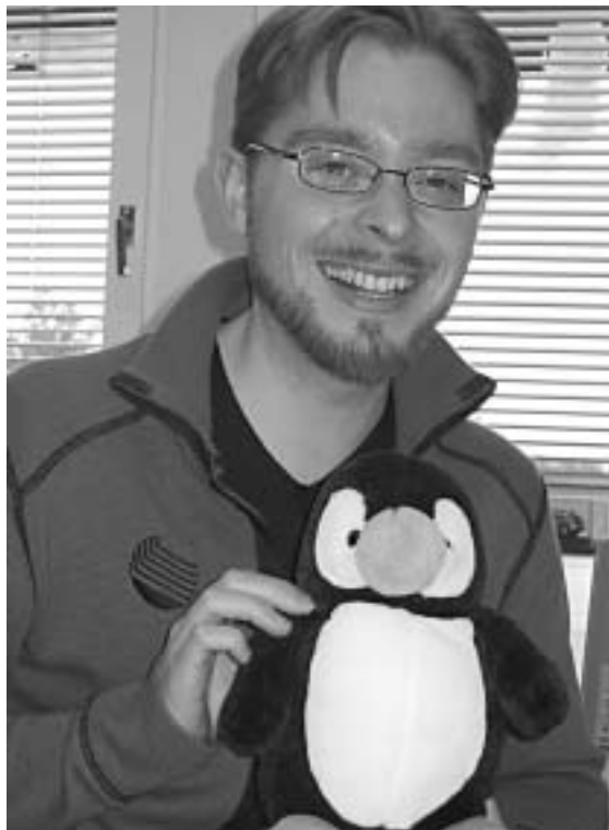
Heitän haasteen takaisin Ilkoille , tällä kertaa Räsä-selle samalla 3. kerroksen sinisellä käytävällä.

Vielä en tiedä, mikä minusta tulee isona. Tähän asti kasvaminen on tapahtunut parhaimmillaan tarttumalla eteen tullessiin mahdollisuuksiin ja haasteisiin. Olenkin oppinut, että elämässä ei ole syytä katua sitä, mitä on tehnyt, vaan ainoastaan sitä, mitä on jättänyt tekemättä. Toivon, että myös TOL on kahdenkymmenen vuoden päästä pystynyt ennakkoluulottomasti reagoimaan ympärillä tapahtuneeseen kehitykseen, ja on siten edelleenkin ajassa kiinni oleva, omat rajansa ja mahdollisuutensa tunnistaava huippuajattelusta koostuva tiedeyhteisö.