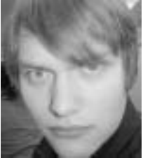
Teksti: Eino Keskitalo

Kadonnut Labyrintti on ihan miekka ja kilpi -kamaa. Märkäkorvaisen sankarin duunina on etsiä jokaiselta luolaston kerrokselta portaat, ja seikkailu tiensä aina vain syvemmälle, ja syvemmälle, ja syvemmälle yhä kauheampien hirviöiden ja kiiltävämpien aarrekasojen äärelle.. niin miksi? Jaa.. enpä itse asiassa ole tullut ot-taneeksi selvää. Eipä se päämäärä peleissä hyvinkään usein ole se olennaisin asia, vaan se matka, se pelaaminen.