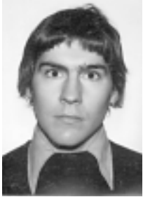
Teksti ja kuvat: Markku Pykkö

Toisin kuin viime vuonna, jolloin kevätexcun peruuntui vähäisen osanottajamäärän takia, tämän vuoden exculle oli tunkua. Kaikki 50 paikkaa tulivat varatuiksi jo kymmenessä minuutissa. Tosin mattimyöhäisille tarjoutui – jälleen kerran – tilaisuus osallistua reissuun, sillä aiempaan tapaan peruutuksia tuli viikkojen mittaan ihan riittävästi.