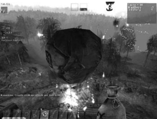
LudoCraftin menestyksekkäs AirBuccaneers (2003)