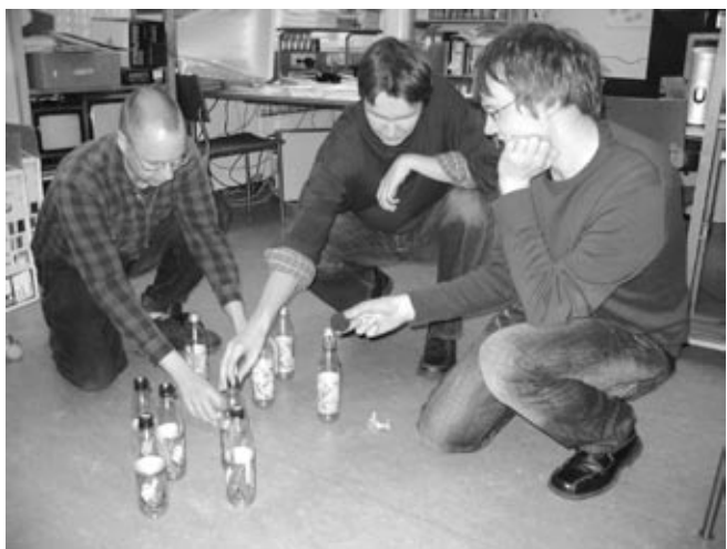
LudoCraftin tutkimusryhmä demonstroi prototyyppiintimenetelmiä

seeks innovative ideas for games and interactive entertainment and helps them become marketable concepts.