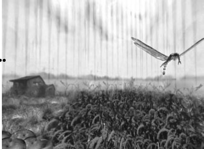
LudoCraftin Dragonfly Variations (2005)

“ELVI” - Environment for Lucrative Virtual Interaction (2005-2007) A regional development project coordinated by LudoCraft, and funded by EU's objective 2 programme (ERDF) and City of Oulu. The project aims to boost regional games and interactive entertainment industry by focusing on the quality of the product and the business as a whole. ELVI