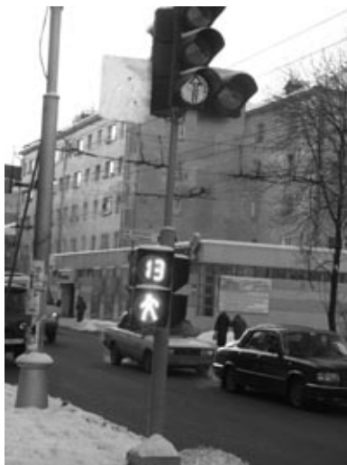
Petroskoissa on jalankulkijoille fiksi ajannäyttö vihreän valon kestolle